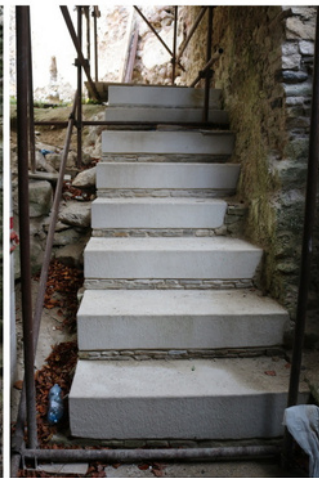
STAV „SCHODISKA PIVNICE“ PO ZÁSAHU V ROKU 2023

Záchranné práce na obnove hradu pokračovali v roku 2023 na viacerých úsekoch. Teší nás, že generálnym partnerom obnovy bolo opätovne Ministerstvo kultúry SR cez grantový program Obnovme si svoj dom, ktoré už od roku 2004 prispieva na základe podaných projektov združenia. Vďaka tejto podpore sa projekt obnovy hradu nezastavil a neustále úspešne pokračuje.