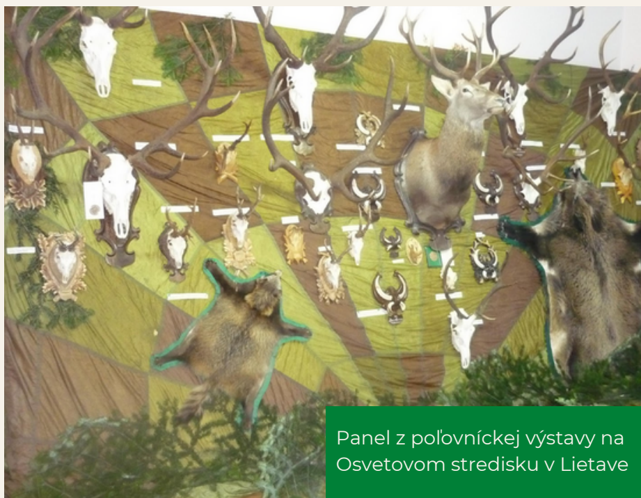
Panel z poľníckej výstavy na Osvetovom stredisku v Lietave

Na základe znalostí a ohlasov v obci musím konštatovať, že náš úsek patrí k mini-spoločenským organizáciám v obci. Asi pred desiatimi rokmi sme založili tradíciu varenia poľníckeho guláša na dedinských oslavách v lete i v zime. Toto podujatie sa teší veľkej obľube našich občanov, je vyhľadávané a očakávané. Okrem toho s určitou periódou sme robili tri poľnícke výstavy nami ulovenej zveri. Najväčší ohlas mala výstava na osvetovom stredisku v počiatkoch našej aktivity. Až na nej sa mnoho občanov dozvedelo a na vlastné oči videlo, čo žije, a čo sa loví v našich lesoch. Od vzácných kusov, ako bol psík medvedíkovitý alebo šakal, až po grandiózne trofeje jelenej zveri a diviačej zveri.