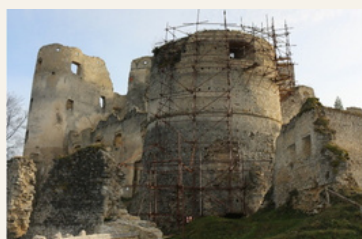
STAV „RONDELOVEJ BAŠTY“ PRED ZÁSAHOM V ROKU 2022