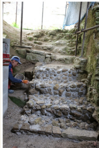
STAV „SCHODISKA PIVNICE“ PRED ZÁSAHOM V ROKU 2023