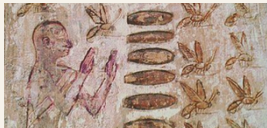
Freska zo starého Ríma zobrazujúca včelstvo

V starovekom Grécku bola včela vyobrazená na minciach – Ephesos. Včela medonosná mala u panovníkov, ale aj svojho ľudu vždy svoju magickosť a ctihodnosť. Po tisíce rokov bol med jediným známym sladidlom a je celkom prirodzené, že v staroveku sa na malé stvorenie, ktoré vyrábalo toto sladké jedlo, pozeralo s úctou a bážňou. Poznáme 7 divov sveta vytvorených človekom. Existujú však nevysvetliteľné javy, ktoré vznikli dávno pred tým, ako sa objavil človek, a ktoré nevieme vysvetliť. Jedným z najzaujímavejších takýchto javov je včela. Zobierala do seba všetko to, o čo sa usilujeme my: vynikajúcu organizáciu života a práce, silu a odvahu, pôvab, inteligenciu a veľkolepú bioenergetiku.