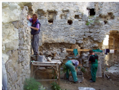
EKPOZÍCIA A JEJ STAV PRED ZÁSAHOM V ROKU 2005

Záchranné práce na obnove hradu pokračovali v roku 2023 na viacerých úsekoch. Teší nás, že generálnym partnerom obnovy bolo opätovne Ministerstvo kultúry SR cez grantový program Obnovme si svoj dom, ktoré už od roku 2004 prispieva na základe podaných projektov združenia. Vďaka tejto podpore sa projekt obnovy hradu nezastavil a neustále úspešne pokračuje.