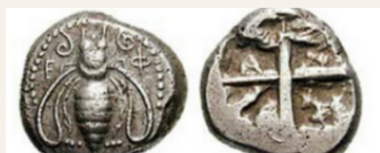
Helenské mince v Efeze

Prvú zmienku o včelárni na Slovensku zaznamenal grécky filozof Priscus, ktorý prišiel v roku 448 n. l. s posolstvom cisára Theodósia k hunskému vodcovi Attilovi. Priscus napísal: „Z dedín nám prinášali ľudia potravu, namiesto obilia proso a namiesto vína med, tak menujú to obyvatelia týchto miest.“ Ohľadom včelárstva malo veľký význam zakladanie kláštorov, keď v zakladacích listinách kláštorov bola vždy zmienka o včelách. Med bol vhodným pôstnym jedlom a patril medzi základné zdroje obživy, pretože bol jediným sladidlom. Slúžil však aj na výrobu medoviny a, samozrejme, vosk na výrobu sviec. Epoque brtníctva má svoj počiatok v mladšej dobe kamennej, keď bol ľud už usadený, zaoberal sa poľnohospodárstvom, pestoval rastliny, choval zvieratá a mal svoje trvalé sídla. Rozvoj lesného včelárenia bol spojený s dobou bronzovou, keď bol dopyt najmä po vosku. Kláty so strieškou alebo časti bŕtlavých stromov, kmeňov s dutinami pre včely, boli vyrezávané pri ľudských obydlíach. Často mali podobu ľudskej postavy či tváre.