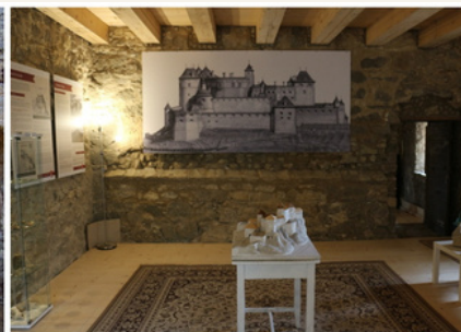
EKPOZÍCIA A JEJ STAV PO ZÁSAHU V ROKU 2017

Pracovalo sa na objekte Pravouhlý bastión – západná stena, kde boli stavebné práce ukončené vo výške stanovenej projektom. Obnovený múr západnej steny už bezpečne slúži návštevníkom ako kamenné zábradlie. Pokračovalo sa v ďalšej stabilizačnej etape obnovy Rondelová bašta, ktorý je verejnosti známy ako Dubová bašta. Bola opravená ďalšia strielňa najvyššieho poschodia tohto objektu. Stavebné práce prebiehali aj na objekte tzv. Kastelánskeho bytu. Tu sa stabilizovala severná stena Kostkovej palácovej prístavby, kde je umiestnená nová strecha. Tá prekrýva dosiaľ verejnosti neprístupnú časť hradu, ktorá bude v budúcnosti slúžiť ako reprezentačný priestor.