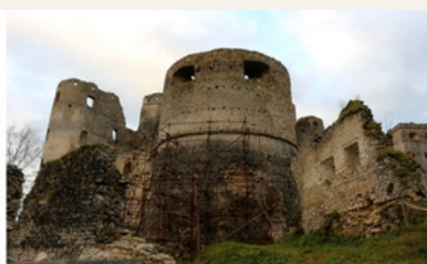
STAV „RONDELOVEJ BAŠTY“ PO ZÁSAHU V ROKU 2023