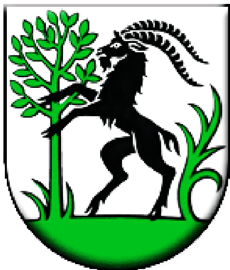
ERB OBCE LIETAVA