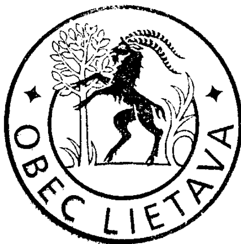
PEČAŤ OBCE LIETAVA